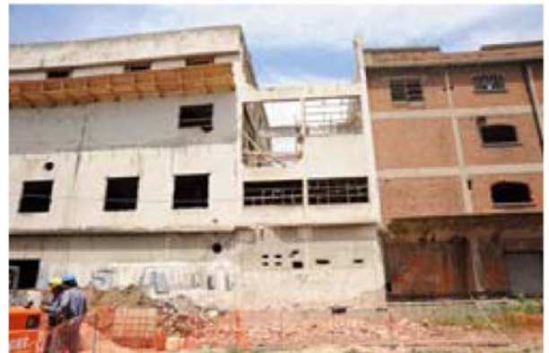
Unión a demoler de los edificios Rojo y Blanco.