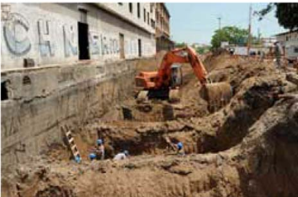
Excavaciones en el sector del Edificio Nuevo - Institutos.