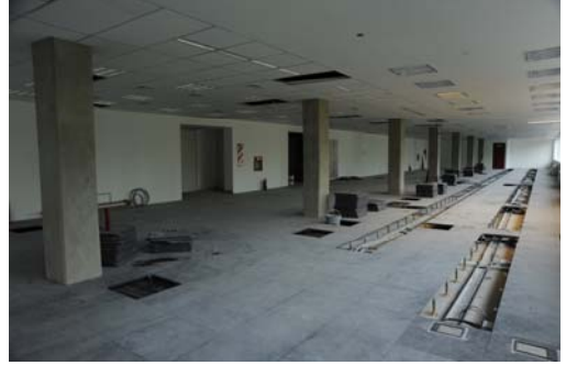
Vista interior del Edificio Blanco - Agencia.