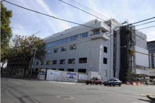
Vista desde la calle Paraguay del Edificio Blanco - Agencia.