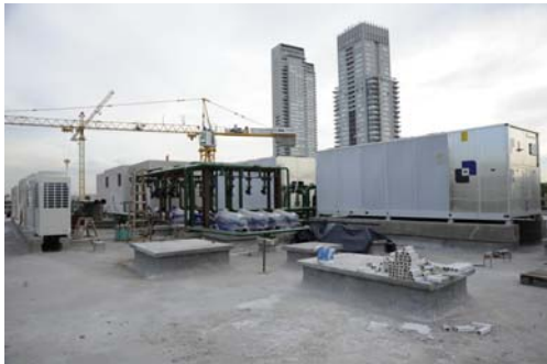
Equipos y cañerías de aire acondicionado en las azoteas.